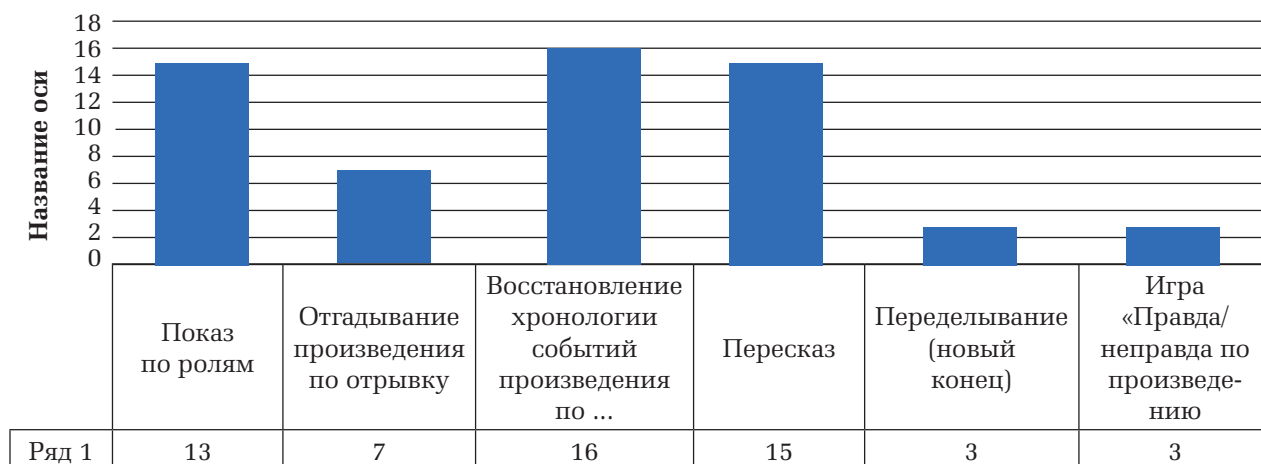
Рис. 2. Результаты анализа видов деятельности

конкурсные материалы, мы выявили, что при работе с литературным произведением преобладают репродуктивные формы работы, такие как пересказ, восстановление хронологии событий и показ по ролям. Данные формы ориентированы не столько на понимание смысла и углубления в воспитательное значение произведения К.Д. Ушинского, сколько на запоминание и развитие способности вспомнить и воспроизвести.