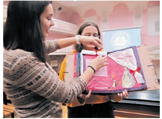
Скрапбук по сказке Э.Т.А. Гофмана