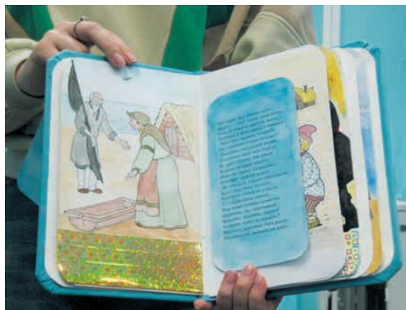
Артбук по сказке А.С. Пушкина

Особую популярность приобрели артбуки, или рукотворные книги, оформленные как эскизные блокноты, содержащие рисунки, коллажи, сопровождающие художественный текст для чтения ребенку дошкольного возраста. Артбук в издательской индустрии можно сравнить с графическими альбомами и книгами-комиксами. Известный литературовед Ю.М. Лотман сопоставлял графические альбомы с иконами, народным лубком, книжкой-картинкой «по исторической обусловленности и художественной ценности» [3], считая подобные книги (современные артбуки) образцами повествования и одновременно живописными средствами и словесными текстами. Подобно комиксу и графическому альбому, артбук сочетает в себе художественный текст и его творческое комментирование в форме картинок, иллюстраций, графических объектов. Как же создать со студентами такую рукотворную книгу для дошкольника? На что обратить внимание?