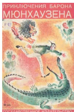
Обложка к книге Э. Распе «Приключения барона Мюнхгаузена». Иллюстратор С. Мочалов

Как мы видим, софтбук – интересный формат художественного текста.