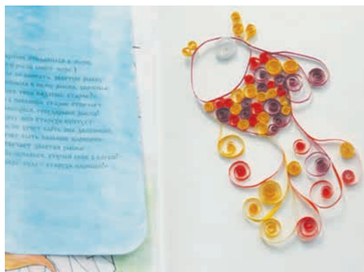
Артбук по сказке А.С. Пушкина