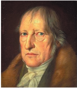
Георг Вильгельм Фридрих Гегель

дителей», то Гегель первым поднимает проблему и, по сути, задает дискурс о взаимоотношениях родителей, общества, государства в воспитании. Исходя из своей философской установки, он ставит общество несколько выше, как «всеобщую семью». Однако подчеркиваются «естественные» права родителей, и они ставятся под защиту закона и государства (ныне такой подход отражен в действующем Основном законе Федеративной Республики Германии).