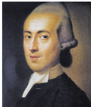
Иоганн Готфрид Гердер

Иогáнн Гóтфрид Гёрдер (1744–1803) – писатель и историк культуры – говорил о воспитании как о воздействии на мир посредством раскрытия «внутренних сил» индивида [3]. Он считал, что гуманность проявляется в целостном облике (Gestalt) человека – не только внутреннем, духовном, но и внешнем, морфологическом строении, в красоте и благородстве тела и лица. Высшим идеалом для Гердера была вера в торжество всеобщей гуманности, в осуществление гармонического единства человечества во множестве индивидов, каждый из которых достиг максимальной реализации своего уникального предназначения.