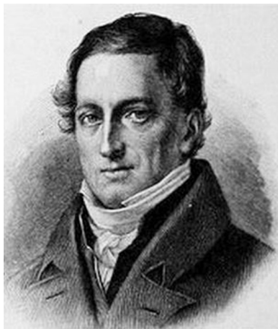
Иоганн Фридрих Герbart

Фридрих Фрёбель (1782–1852) может быть приведен как пример адепта идей всеобщности законов бытия и трактовки назначения человека следовать божественному порядку, развивать «свою сущность» и «свое божественное начало». В основу своей педагогики Фрёбель поставил теорию игры. Он считал, что детская игра – «зеркало жизни» и «свободное проявление внутреннего мира». Игра – мостик от внутреннего мира к природе, средство, с помощью которого устанавливается связь между внутренним миром ребенка и внешним [4].