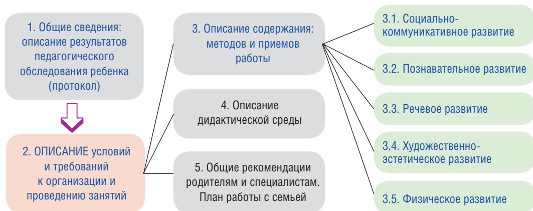
Рис. 4. Структура индивидуальной программы