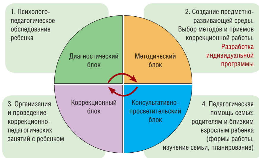
Рис. 1. Структура коррекционно-педагогической работы

и уровень самостоятельности служат основой для определения методов и приемов коррекционного обучения.