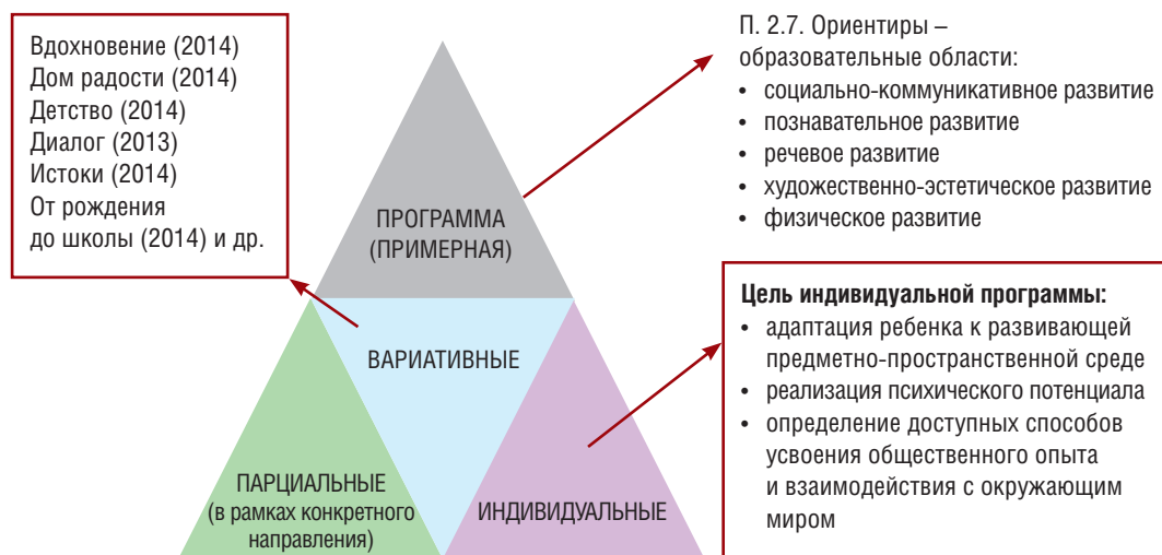
Рис. 2. Программный блок коррекционной работы

Индивидуальная программа, как неотъемлемая часть методического блока коррекционной работы, включает задачи по адаптации ребенка к развивающей предметно-пространственной среде путем расширения возможностей двигательной, познавательной и речевой активности, а также элементарной социально-бытовой ориентировки в процессе доступных видов детской деятельности (рис. 2).