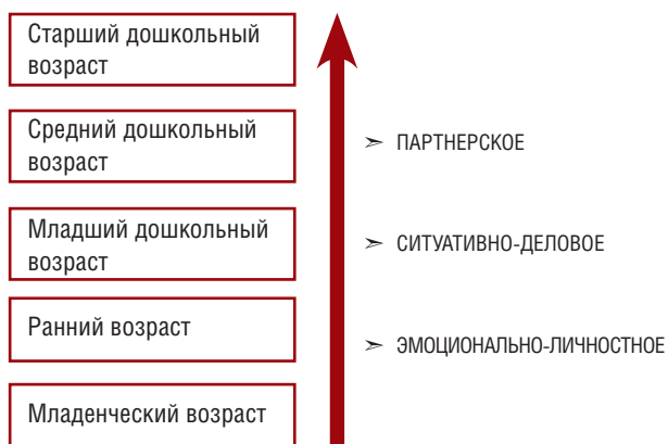
Рис. 3. Виды взаимодействия взрослого с ребенком