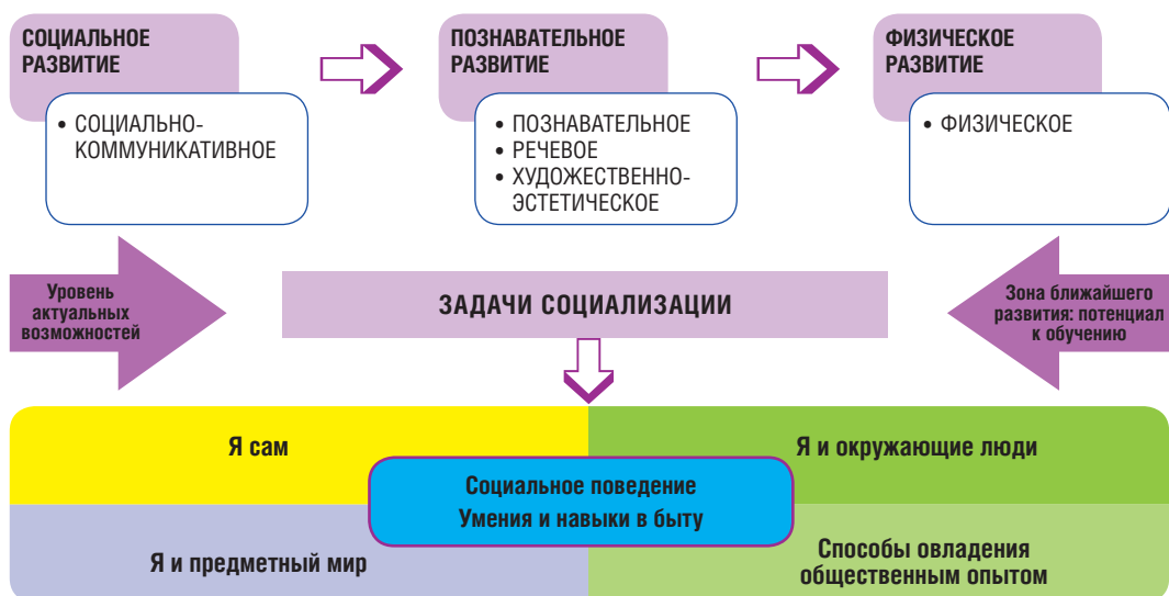
Рис. 6. Содержание коррекционных занятий

С одной стороны, имеются требования ФГОС и направления образования, содержание которых наполняется специальными задачами коррекционного обучения; с другой – есть ребенок с особенностями развития, с ограничением адаптации и спецификой восприятия окружающей действительности. На наш взгляд, главным направлением его воспитания должна быть социализация, что позволяет не только учитывать актуальные возможности ребенка по всем направлениям образования (это вполне отвечает требованиям ФГОС ДО), но и раскрывать потенциал его развития в близких к жизненному опыту ребенка ситуациях (рис. 6).