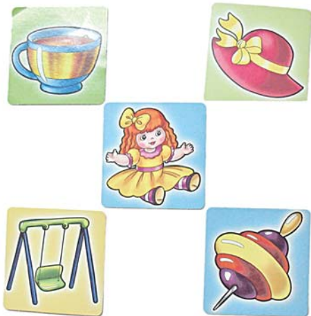
Фото 9. «Кукла – чашка с чаем» («Кукла пьет чай»); «кукла – шляпа» («Кукла носит красивую шляпу»); «кукла – качели» («Кукла качается на качелях»); «кукла – юла» («Кукла играет с юлой»)