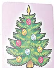
Фото 6. «Клоун – елочка» («Клоун выступает на празднике», «Игрушка-клоун висит на елочке»)

тельно рудиментарными формами воображения» [1]. Кроме объяснений младшими детьми своего настроения, выбора листов цветной бумаги, а главное – выбора картинок, осуществляется ими и подбор слов из разных частей речи: синонимов («Как еще по-другому можно сказать про...»), антонимов («Скажи наоборот про...»), подбор слов в уменьшительно-ласкательной форме («Как можно ласково сказать про...»). Дошкольники также вспоминают загадки, ранее выученные стихи про то, что нарисовано на картинках, отвечают на различные вопросы: каков предмет по цвету, запаху, форме, вкусу, как он передвигается, какую пользу приносит и т.д.