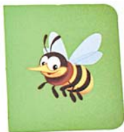
Фото 2. «Пчелка – клубничка с цветочком» («Пчелка летит на цветочек»)