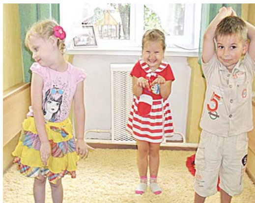
Фото 7. «Лисичка, волк и обезьянка»

вами: говорить, бегать, прыгать, смеяться, чувствовать запахи, вкус, боль, совершать несвойственные ему поступки: петь, танцевать, разговаривать, мечтать. Каждый этюд – это «воображение в движении» (Л.С. Выготский), одновременно он выполняет еще и функцию физкультминутки (см. фото 7, 8).