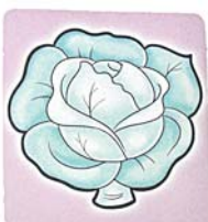
Фото 3. «Лейка – капуста» («Капусту надо поливать, чтобы выросла»)