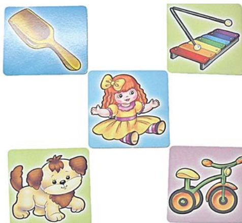
Фото 11. «Кукла – совок» («Кукла совком делает горку из песка»); «кукла – металлофон» («Кукла играет на металлофоне, ей весело»); «кукла – собачка» («Кукла дрессирует собачку»); «кукла – велосипед» («Кукла любит кататься на велосипеде», «Кукла учится ездить на велосипеде»)

их самостоятельность, объяснение действий с проявлением свойств воображения, учет поведения младших детей во время запоминания картинок с опорой на ранее отобранные по смыслу, а также учет объема воспроизведенных картинок (карточек).