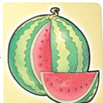
Фото 4. «Машина – арбуз» («Машина привезла вкусные арбузы»)