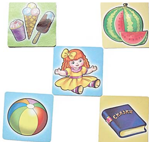
Фото 10. «Кукла – мороженое» («Кукла любит есть мороженое»); «кукла – арбуз» («Куклу угостили арбузом»); «кукла – мячик» («Кукла играет с мячиком»); «кукла – книжка» («Кукла любит слушать сказки»)

Эффективность РТИ определяется по таким критериям, как осмысленность выполнения действий детьми в процессе игр,