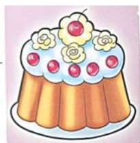
Фото 5. «Чашка – торт» («Я люблю пить чай с тортом»)

ется до четырех–пяти, и, следовательно, на такое же количество увеличивается и подбор картинок, сходных по смыслу. При осмысленном выполнении заданий дошкольники по своему желанию в одной игре могут выбирать и большее количество картинок (более пяти).