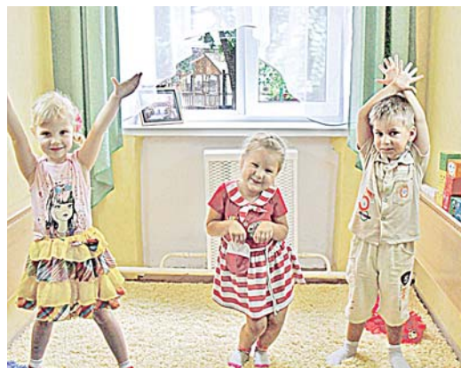
Фото 8. «Птичка, зайчик и олень»

Каждая РТИ завершается важным приемом нравственно-эмоционального воспи-