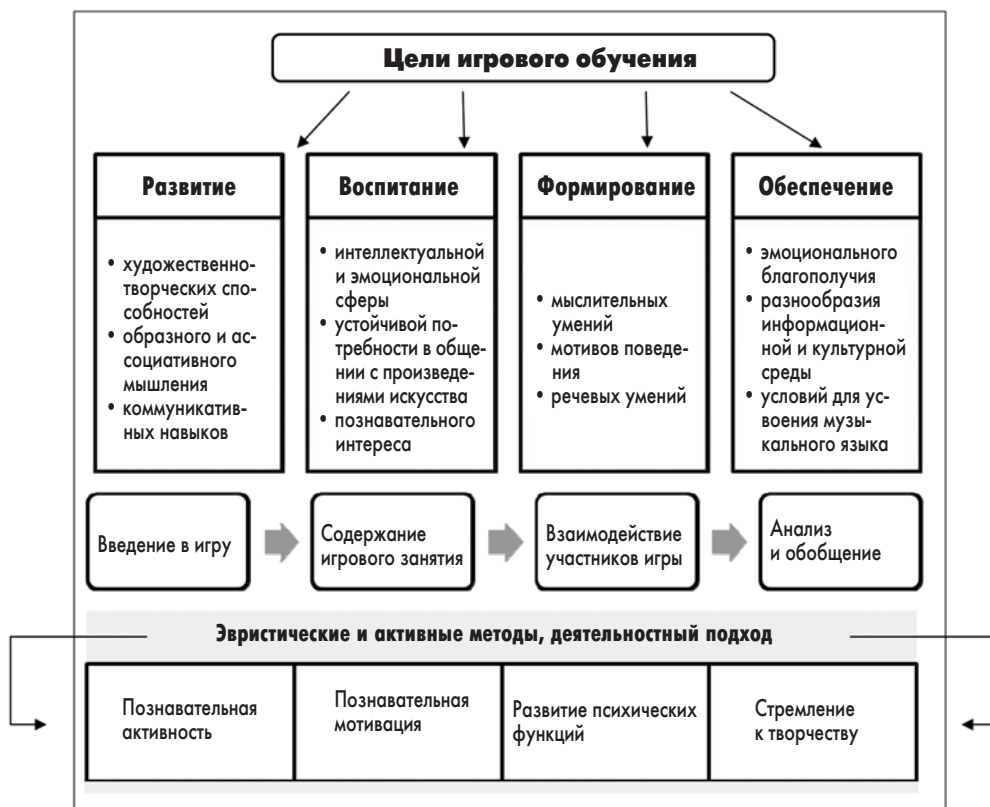
Рис. 1. Обоснование преимуществ организации музыкального занятия в игровой форме

висимости от ситуации. Использование метода игрового моделирования позволяет углубиться в конкретную игровую ситуацию, овладеть не только знаниями об определенном объекте, но и способами его познания, изменения. Ведущим видом деятельности в этом возрасте, как известно, является игра, поэтому продуктивность развития интеллектуально-творческого потенциала дошкольников определяется использованием игровых форм деятельности в музыкальном образовательном процессе.