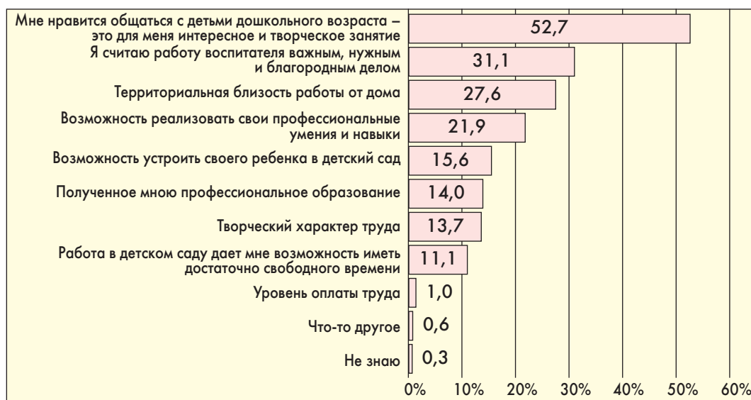
Рис. 1. Распределение ответов о мотивах, которыми руководствовались воспитатели при выборе профессии, %

Таким образом, педагогическое образование оказывает заметное влияние на мотивацию выбора профессии: воспитатели со средним педагогическим образованием более важным считают мотив общения с детьми, а воспитатели с высшим педагогическим образованием сориентированы на профессиональную самореализацию.