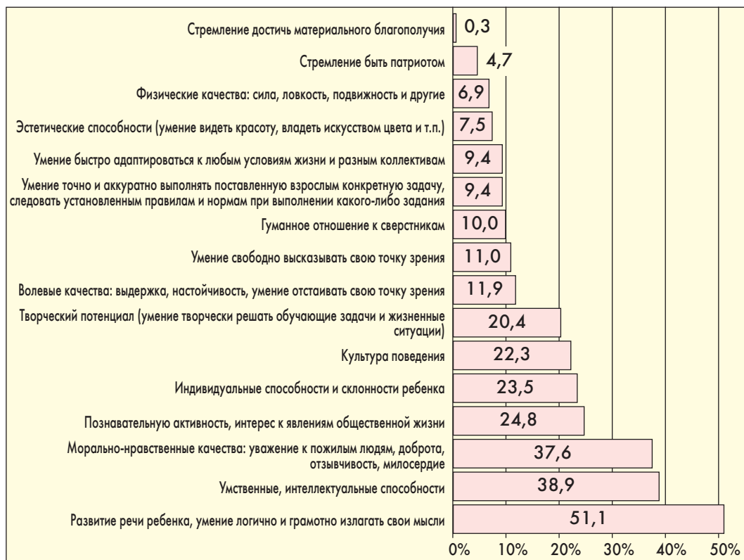
Рис. 3. Распределение ответов на вопрос о том, что, прежде всего, необходимо формировать, воспитывать и развивать у детей дошкольного возраста, %

Таким образом, молодые воспитатели с небольшим педагогическим стажем ориен-