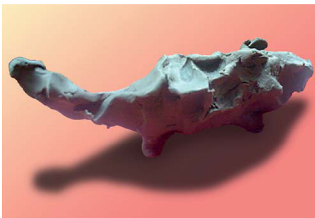
Фото 8. «Мурка» (Витя К., 4,5 года; первый блок занятий, тема «Лепка с натуры»)

будут лежать или сидеть? может, выгибать спину? а может, шипеть? Приступайте к работе, тщательно разомните пластилин, для того чтобы работы получились как живые. Не забывайте, мы лепим из целого куска, вытягивая части.