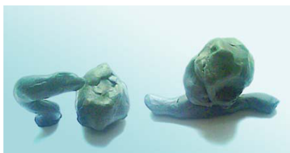
Фото 11. «Трус и Смелчак» (Алеша М., 6 лет; четвертый блок занятий, тема «Трусость–храбрость»)