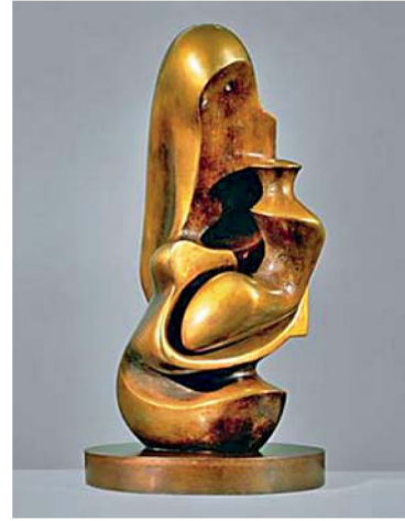
Фото 2. «Мать и дитя» («капюшон») (Г. Мур, Англия, 1982)

кусстве господствовали жесткие каноны, неизвестные скульпторы находили особые средства, чтобы прояснить, осмыслить, разграничить в своих композициях такие базовые, оппозиционные, человеческие понятия и моральные категории, как добро и зло, скромность и роскошь и многое другое [8]. Чаще всего это достигалось с помощью придания скульптуре определенных атрибутов. Современные скульпторы продолжают в своем творчестве поиск новых средств. Одним из новонайденных понятийных выразительных средств является беспредметность, бестелесность, отсутствие объекта . В творчестве скульпторов второй половины XX в. (фото 1–4) форма, приобретая абстрактный характер, репрезентирует внутреннее состояние, эмоции, чувства, переживания, идеи. Произведения этих скульпторов стали средством осмысления мира, утверждающим право автора передавать «авторским символом» субъективный смысл собственного образа мира.