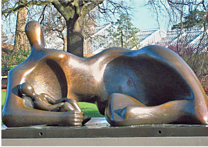
Фото 1. «Мать и дитя» (Г. Мур, Англия, 1983)