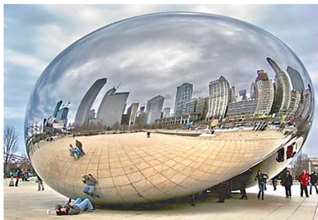
Фото 4. «Облачные врата» (А. Капур, США, 2006)