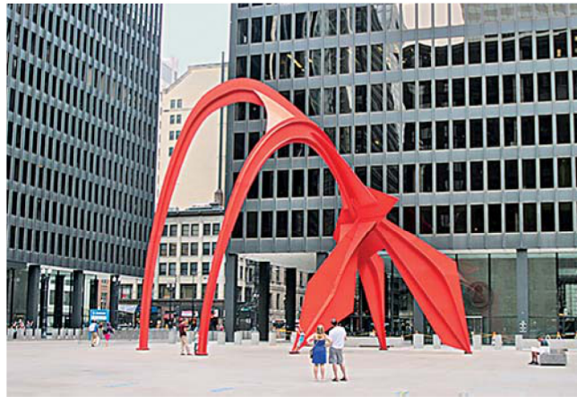
Фото 3. «Фламинго» (А. Колдер, США, 1974)

«Авторский символ» как средство передачи собственных состояний, настроений, переживаний и личного мироощущения