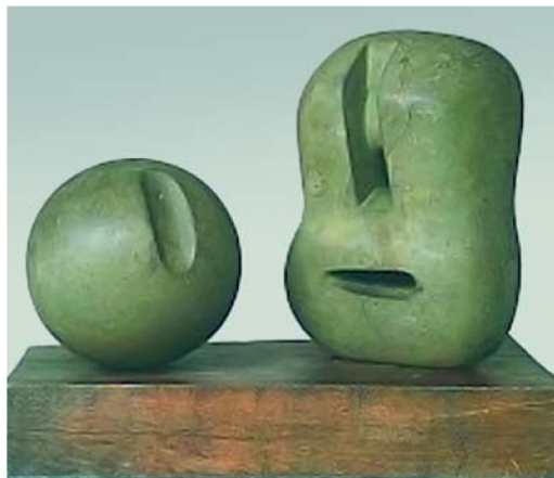
Фото 5. «Две формы» (Г. Мур, Англия, 1936).